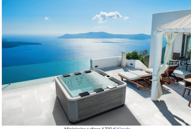
Minipiscina a sfioro A700 di Kinedo

Il relax è totale: spesso caratterizzate da un sistema di idromassaggio, le minipiscine (da interno o esterno) offrono interessanti funzionalità per chi cerca un'oasi di pace privata. Le funzionalità legate al wellness non si esauriscono qui: una mini spa è dotata di cromoterapia, un sistema di luci Led colorate in grado di creare affascinanti giochi di luce. Ma non solo: la possibilità di scegliere la propria musica tramite Bluetooth e l'aromaterapia rendono l'esperienza ancora più rilassante.