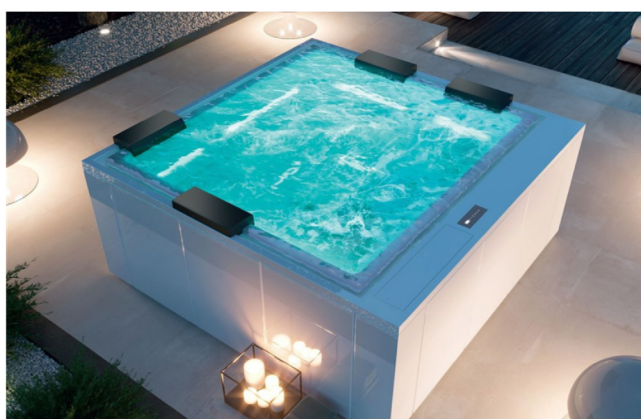
Phantom è la minipiscina di Treesse

Progettata dal designer Marc Sadler, Phantom è la minipiscina di Treesse dotata della tecnologia brevettata "Ghost Plus": l'hardware dell'idromassaggio è collocato in una fessura perimetrale che consente di ottenere un design della vasca pulito e minimale. Phantom può essere posizionata sia ad incasso o in appoggio ed è possibile personalizzarla scegliendo la pannellatura in vetroresina, la finitura in legno o la copertura termica in antracite.