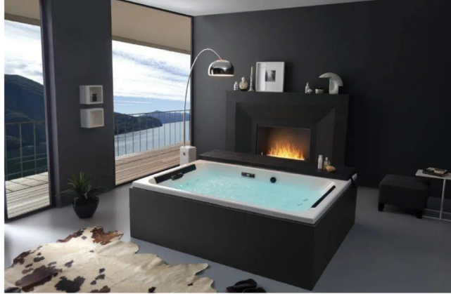
SpaLoft è la minipiscina da interno di Kinedo

Dove si posiziona una mini piscina idromassaggio? Le aziende specializzate nella realizzazione di queste rigeneranti soluzioni propongono prodotti dedicati sia all'installazione interna che esterna. I modelli sono caratterizzati da materiali, finiture e persino forme differenti perfettamente adattabili sia con il design indoor che con quello outdoor.