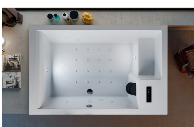
Collezione Mawi Spa di Glass 1989

La collezione Mawi Spa di Glass 1989 trasforma la mini piscina in un elemento d'arredo. 8 getti idromassaggio Filo, 16 getti airpool, 2 faretti con luce e cromoterapia e un'elegante pannellatura di Lycra Xtra Life ed Ecoresina caratterizzano questa versatile struttura biposto.